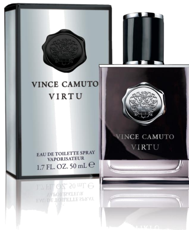
Eau de Toilette 50 ml