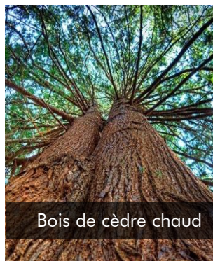
Bois de cèdre chaud