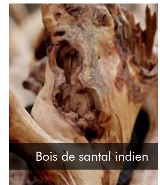
Bois de santal indien