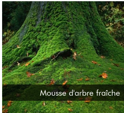
Mousse d'arbre fraîche