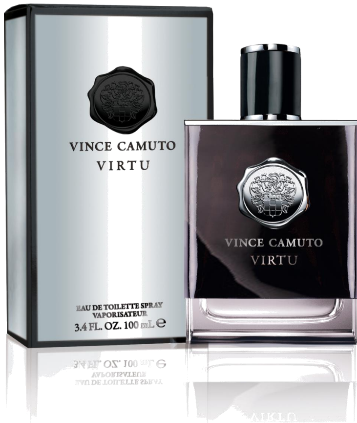
Eau de Toilette 100 ml